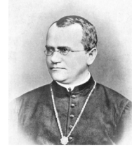
【科學史上的七月】 遺傳學之父-孟德爾 (Gregor Mendel) (1822 - 1884)

自1856年開始，孟德爾花了八年時間不斷以人工方式讓豌豆雜交產生子代，觀察記錄了約二萬九千株豌豆的性狀與數量，終於在1865年發表實驗結論。